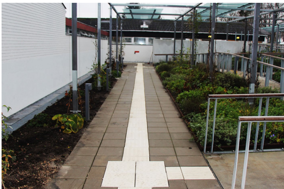
Udført projekt CFD Herlev

Alle ledelinjefliser overholder de nyeste EU krav om tilgængelighed. jf. "DS/ISO 23599" - 2012.