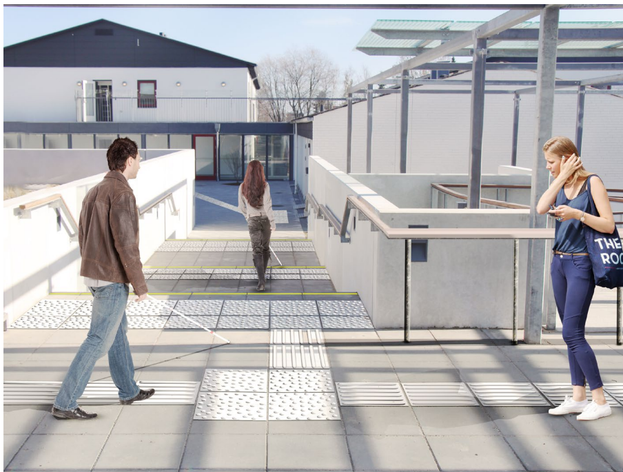
Udført projekt CFD Herlev

Fliserne kan tilpasses og produceres i alle mål.