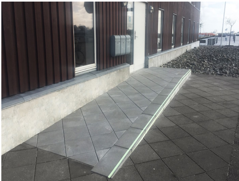
Udført projekt privatlægeklinik

Mål: h 150/155 x b 600 x d 300 Mål: h 150/155 x b 300 x d 300